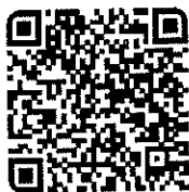
สิ่งที่ส่งมาด้วย