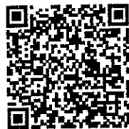
QR Code แบบสำรวจ สถานการณ์เด็กไทยกับภัยออนไลน์ ปี ๒๕๖๕