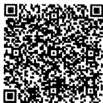
สิ่งที่ส่งมาด้วย