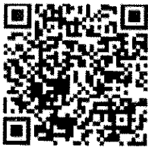
แบบตอบรับ

รองอธิบดี ปฏิบัติราชการแทน อธิบดีกรมส่งเสริมการปกครองท้องถิ่น